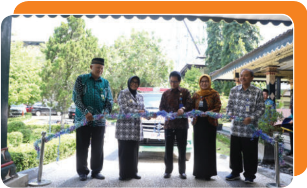
Bantuan mobil ambulan kerjasama dengan Baznas dan PUDAM Sleman Ambulance assistance in collaboration with Baznas and PUDAM Sleman