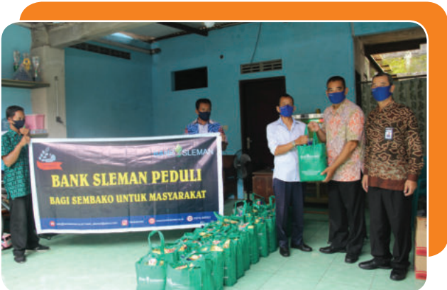
Bank Sleman Peduli Bantuan sembako untuk warga sekitar di lingkungan Bank Sleman Bank Sleman Peduli for Basic food assistance for residents in the vicinity of Bank Sleman