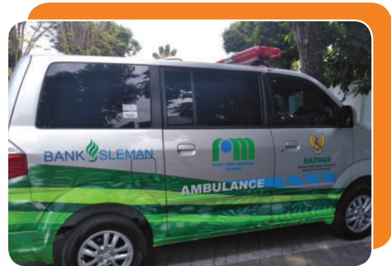
Bantuan mobil ambulan kerjasama dengan Baznas dan PUDAM Sleman Ambulance assistance in collaboration with Baznas and PUDAM Sleman