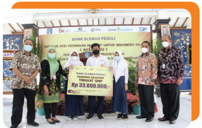
Bank Sleman Peduli Beasiswa kepada Pelajar tingkat SD dan SMP di Kabupaten Sleman Sleman Bank Cares for Scholarships for Elementary and Junior High School Students in Sleman Regency