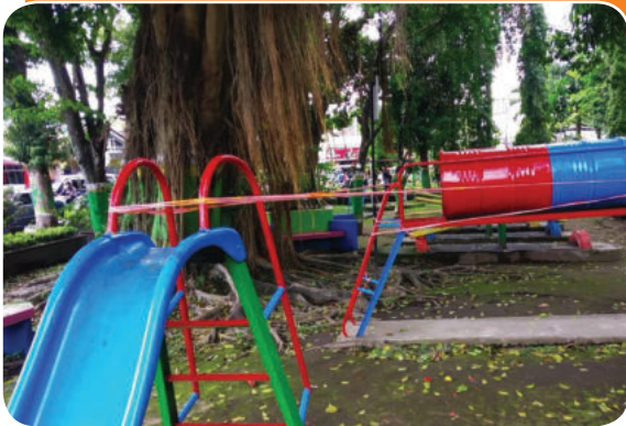
Bank Sleman Peduli Bantuan Perbaikan Alat Permainan Ramah Anak Taman Denggung Sleman Bank Peduli for Help Repairing Denggung's Child-Friendly Game Tools

In 2020, the distribution of CSR funds for other programs was realized amounting to Rp246,602,992 or 16.73% of the total distribution of CSR funds in 2020 amounting to Rp1,473,897,992.