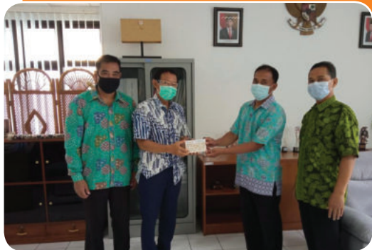
Bank Sleman Peduli bantuan bedah rumah Rumah Tidak Layak Huni (RTLH) kepada warga kurang mampu di Kabupaten Sleman

Bank Sleman Peduli for Islamic Boarding Schools and Orphanages in the Regency