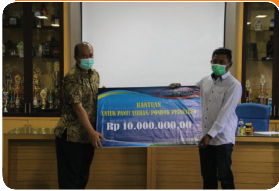
Bank Sleman Peduli Bantuan Pondok Pesantren dan Panti Asuhan di wilayah Kabupaten

Bank Sleman Peduli for Islamic Boarding Schools and Orphanages in the Regency