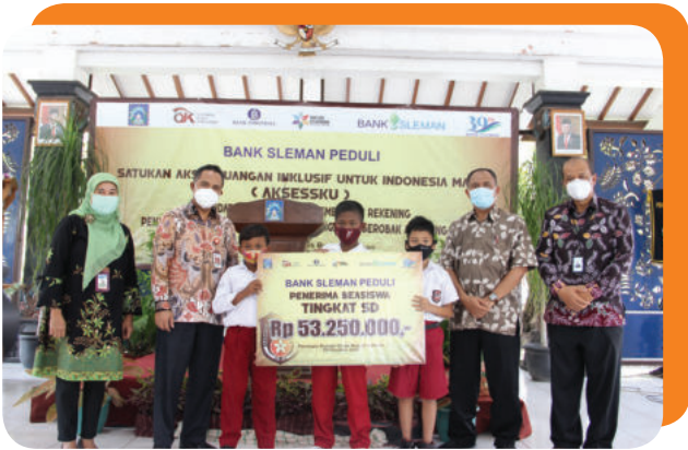
Bank Sleman Peduli Beasiswa kepada Pelajar tingkat SD dan SMP di Kabupaten Sleman Sleman Bank Cares for Scholarships for Elementary and Junior High School Students in Sleman Regency