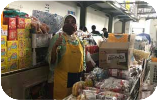
Bantuan apron untuk pedagang pasar di wilayah Kab. Sleman untuk menjaga kebersihan dan kerapian Apron assistance for market traders in the Kab. Sleman to maintain cleanliness and tidiness