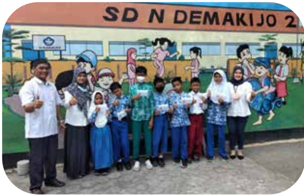
Bank Sleman Peduli Bantuan beasiswa kepada pelajar kurang mampu dan disabilitas tingkat SD Bank Sleman Cares

Scholarship assistance to underprivileged and disabled students at the elementary level