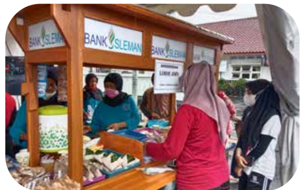
Bank Sleman Peduli Bantuan sarana usaha berupa Gerobak Usaha kepada pelaku UKM Bank Sleman Cares Assistance with business facilities in the form of business carts for SMEs

In 2022, the distribution of CSR funds for the Partnership program was realized in the amount of IDR 335.555.000 or 30,79% of the total distribution of CSR funds in 2022 of IDR 1.089.680.890