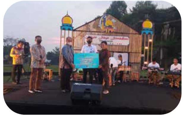
Penyerahan Bantuan Dana untuk Pembelian Mobil Ambulance sebagai Fasilitas Kesehatan di Kalurahan Sambirejo Prambanan Submission of Funding Assistance for the Purchase of an Ambulance Car as a Health Facility in the Sambirejo Village of Prambanan