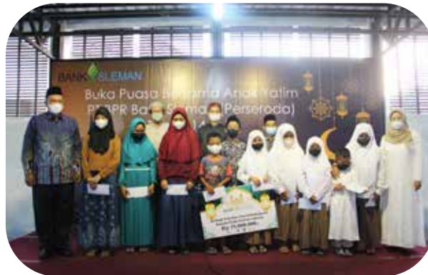
Bank Sleman Peduli penyerahan bantuan kepada pondok pesantren dan santunan anak yatim Bank Sleman Cares

Assistance for Uninhabitable Houses (RTLH)