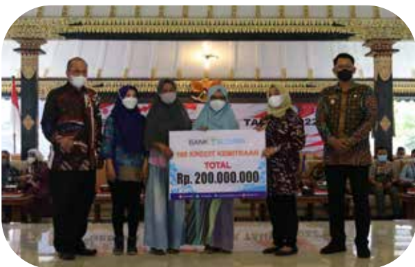
Bank Sleman Peduli Penyaluran Kredit Kemitraan kepada pelaku UKM Bank Sleman Cares Distribution of Partnership Loans to SMEs

Pada tahun 2022, penyaluran dana CSR untuk program Kemitraan terealisasi sebesar Rp335.555.000 atau 30,79% dari total penyaluran dana CSR tahun 2022 sebesar Rp1.089.680.890