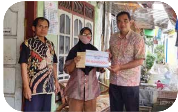
Bank Sleman Peduli Bantuan untuk Rumah Tidak Layak Huni (RTLH) Bank Sleman Cares

Scholarship assistance to underprivileged and disabled students at the elementary level